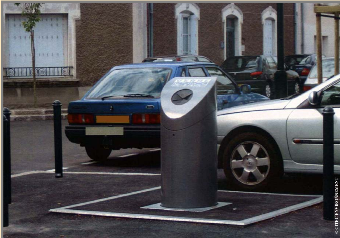
Le conteneur dans son environnement...