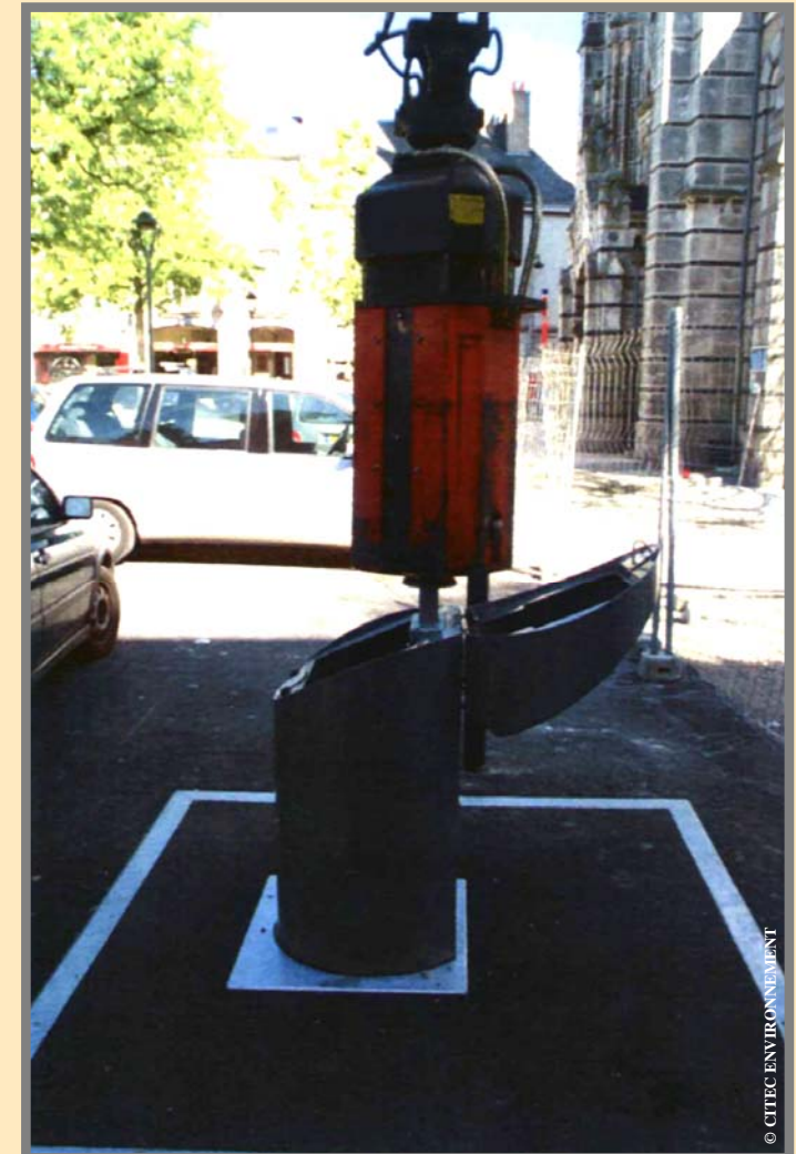
Son système de préhension...